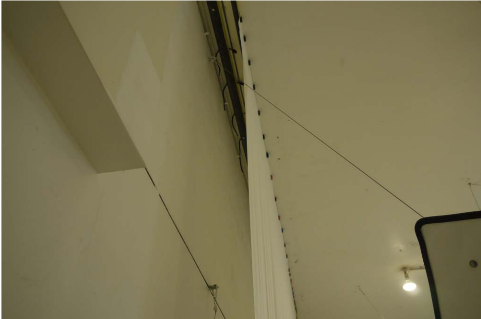
Abbildung B.1. Montage des Vorhangtuches an einem Deckenwinkel