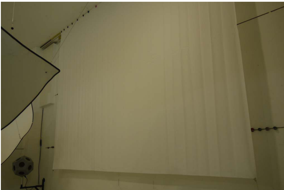
Abbildung B.2. Prüfaufbau im Hallraum